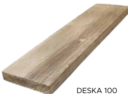
DESKA 100 Obj. kód: DD010025H (250×1000 mm)