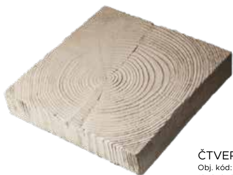
ČTVEREC 25 Obj. kód: DDC02525H (250×250 mm)