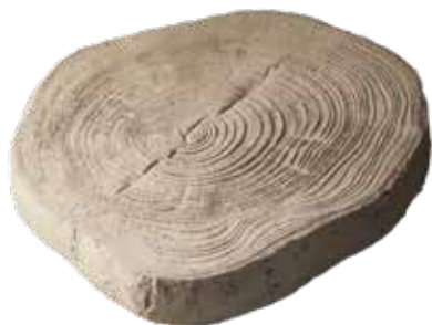
NÁŠLAP MALÝ Obj. kód: DNM03235H (325–355×45 mm)