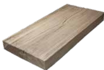
DESKA 50 Obj. kód: DD005025H (250×500 mm)