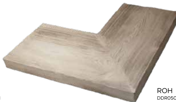
ROH DDR05050H (500×500 mm)