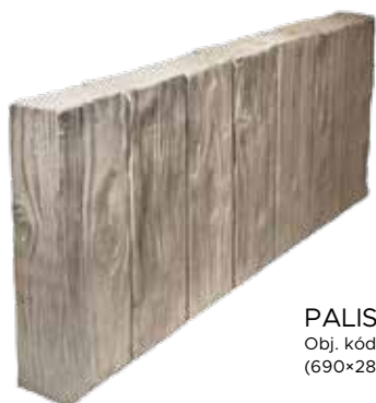
PALISÁDA ROVNÁ Obj. kód: DPR06928H (690×280×60 mm)