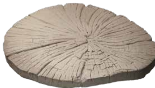
NÁŠLAP VELKÝ Obj. kód: DNV05260H (520–605×50 mm)