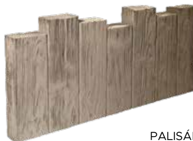
PALISÁDA ČLENITÁ Obj. kód: DPC06928H (690×280–330×60 mm)