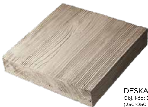
DESKA 25 Obj. kód: DD002525H (250×250 mm)