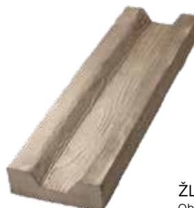
ŽLAB Obj. kód: DOZ05015H (150×500×50 mm)