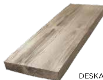
DESKA 75 Obj. kód: DD007525H (250×750 mm)