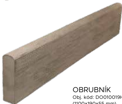
OBRUBNÍK Obj. kód: DO010019H (1100×190×55 mm)