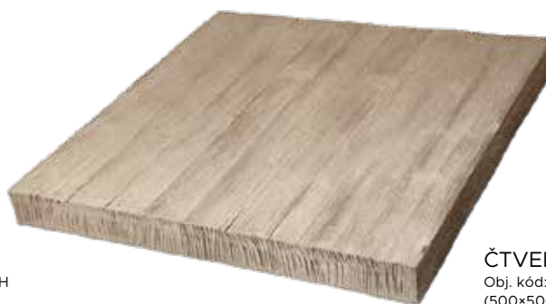
ČTVEREC 50 Obj. kód: DDC05050H (500×500 mm)